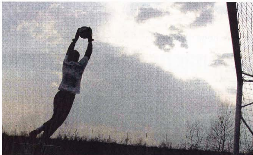
Abenddämmerung: Die Wiener Austria muss sich ohne Rothneusiedl auf eine Zukunft ohne Mäzen Stronach einstellen