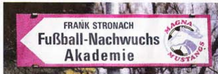
Alle Wege führen zum Nachwuchs: Frank Stronach will mit seinem Magna-Mustangs ein rotweißes Tiger-Team formen

Der kleine Haken: Stronach besitzt nach wie vor Teile der Austria-Transferrechte. Auch die Profis Bak und Kuljic werden vom Mäzen persönlich finanziert.